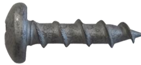
写真1 コースウッドなべ