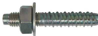
写真2. タップスターTP1060