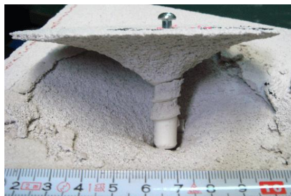
写真4 コーン破壊例(K4+M4.1 木ねじ)