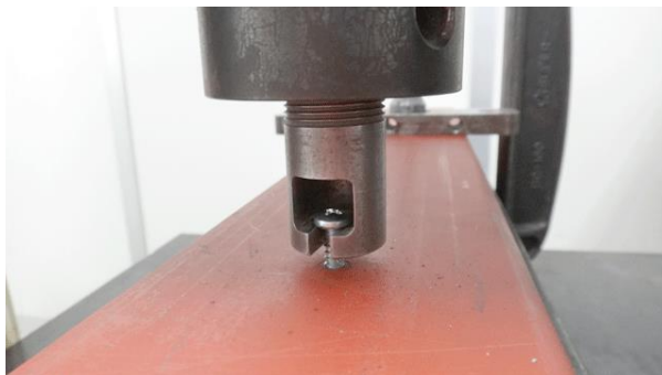
図 4. 試験体

ボード類は介さず下地鋼材裏側に5山程度突出するまで試料をねじ込み試験体を制作した(ねじ込み面は幅 100 の面)。試料頭部に引掛治具をセットし(図 4)、軸方向に載荷して荷重と変位量を測定・記録した。